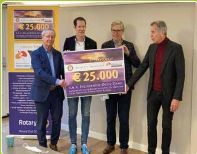
Oude IJssel Doetinchem