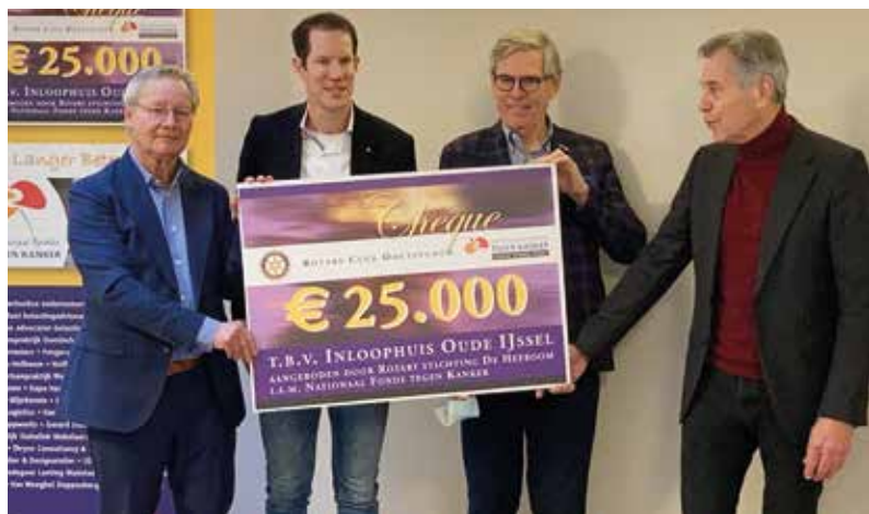
Rotaryclub Doetinchem in actie voor inloophuis Oude IJssel

Samen Sterker Help mee en steun de inloophuizen!